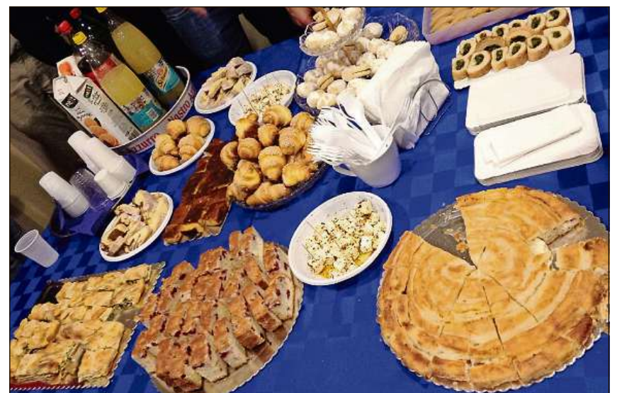
Spezialitads culinarias dals Cincar ch'els han preparà per la «vlach-night».