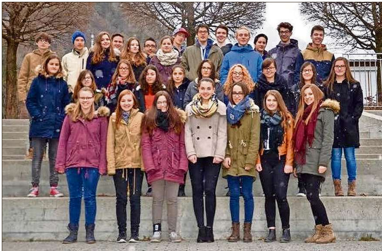
Il Chor Rumantsch da la scola chantunala da Cuira sgola bainprest en ils Stadis Unids da l'America.

Igl Chor Rumantsch ò gia taimps cun pi pac(a)s cantadour(a)s e taimps noua tgi el stava prest alla limita dalla sia existenza e taimps cun bler(a)s cantadour(a)s. Nous ischans fitg loschs tgi igl mument totgan 40 cantadour(a)s agl noss chor. I fò grond plascheir dad aver tants tgi èn motivos ed angaschas per cantar, pigl chor e per la cuminanza. Scu mintg'onn dainsa er chest onn en concert. Ma chest'onn dattigl dus concerts fitg extraordinaris, damai tgi nous luvragn cun