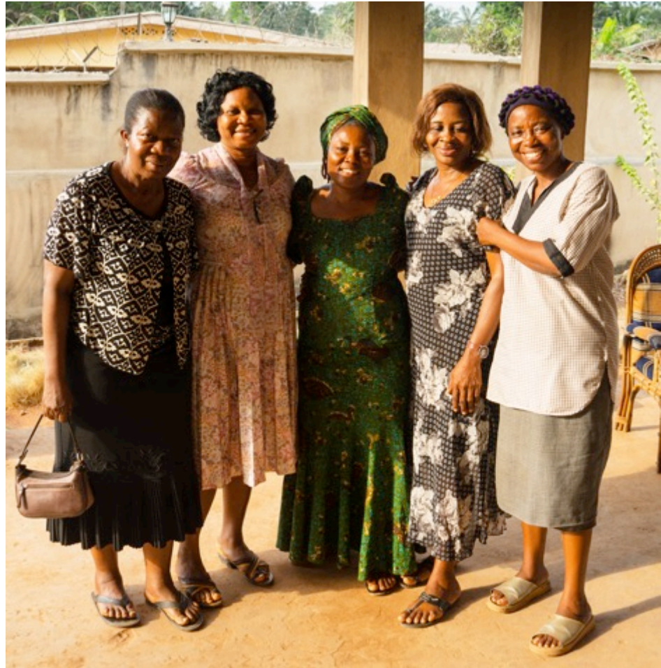
Vorstand der Frauengemeinschaft St. Nicholas in Umunumo, Imo State, Nigeria

JAHRESBERICHT 2016 / RAPPORT ANNUAL 2016