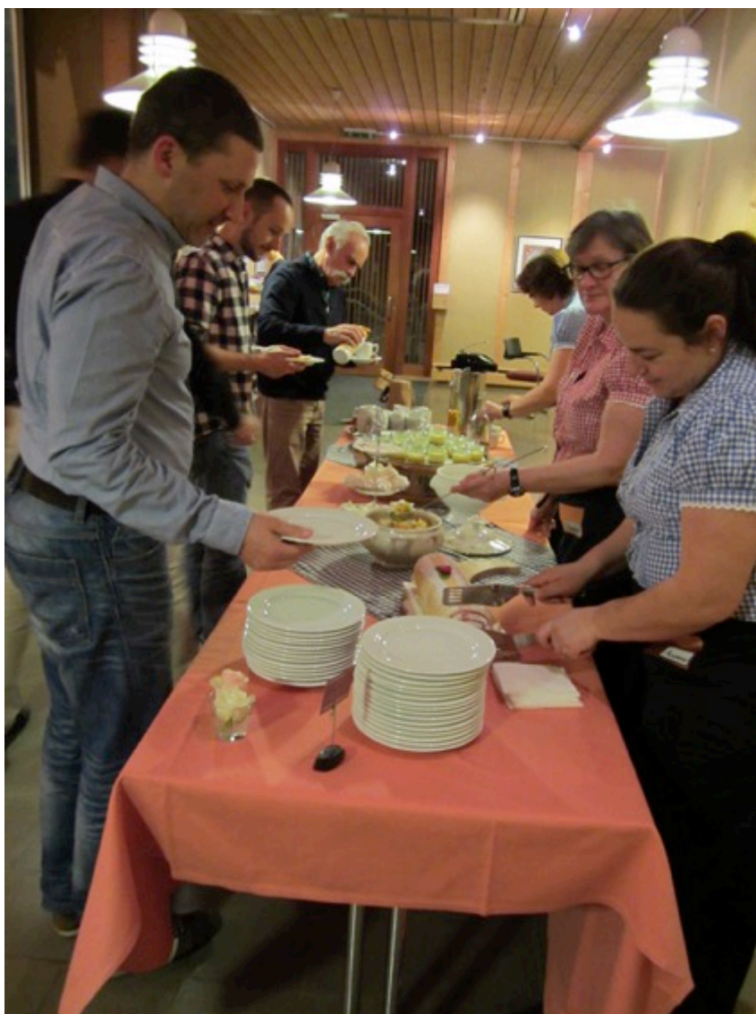
„Amarenda“ am Jubiläumsessen der Stiftung