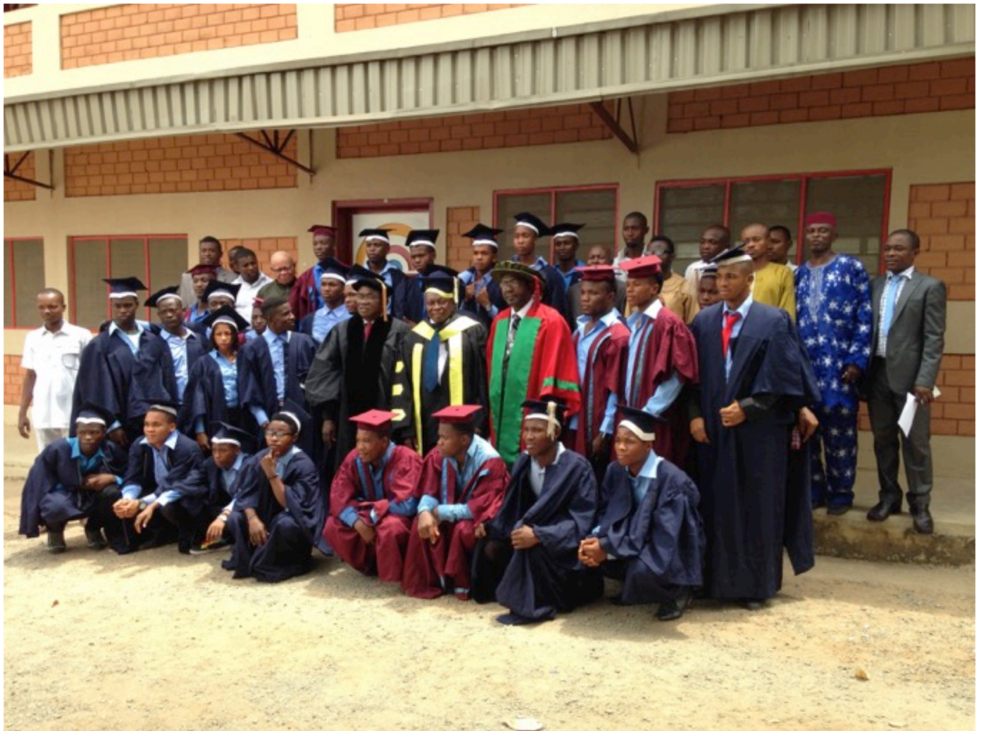
Immatrikulationsfeier 2016 der neuen Studentinnen und Studenten am Mbara Ozioma College of Technology MOCTECH in Umunumo

Fundaziun Tür auf - mo vinavon + Via Raveras 25 + CH-7180 Disentis/Mustér Tel./Fax: +41 (0)81 947 44 10 + tuerauf-movinavon@auaviva-cadi.ch www.auaviva-cadi.ch + www.campscadi.ch + www.arenacadi.ch www.giuventetgnacadi.ch + www.mbaraozioma.ch + www.lumpazi-cadi.ch GKB + IBAN: CH76 0077 4110 3029 4410 0 + Swift: GRKBCH2270A